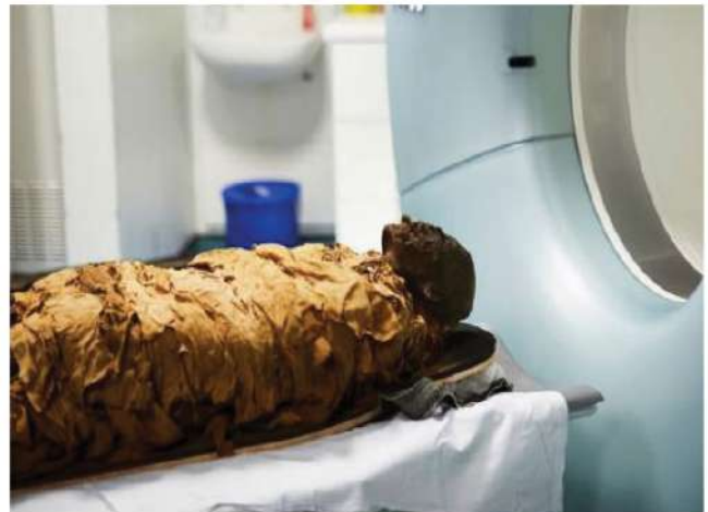
Momia de 3000 años de antigüedad

H emos reproducido fielmente el sonido de su canal en su posición actual, pero no esperamos un habla exacta dado el estado de su lengua”, dijo el coautor David M. Howard, de la universidad Royal Holloway de Londres, se espera que estos experimentos sigan por buen curso para su mejoramiento.