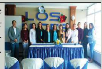
Autoridades del ISTLA

Se realizó el lanzamiento de la revista institucional por los 25 años de vida académica del Instituto Los Andes.