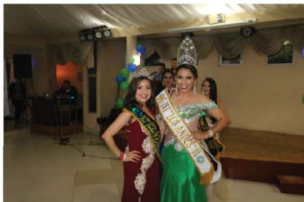
Reina de Los Andes, Srta. Bodas de Plata.

U na noche llena de algarabía y emociones que vivió toda la familia de Los Andes, esperando que este año sea muy productivo y lleno de logros institucionales.