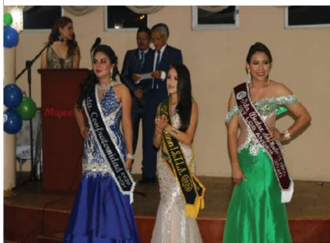
Premiación a las candidatas.