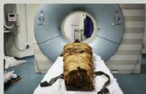
Momia egipcia de 3000 años.

“Hemos reproducido el sonido de su canal pero no esperamos un habla exacta dado el estado de su lengua.