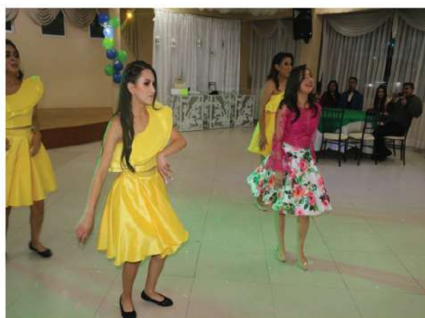
Presentación del baile.