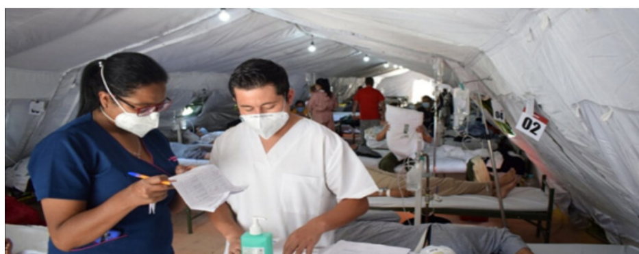
Médicos del Hospital Quito Sur en las carpas militares atendiendo a pacientes con Covid – 19.

acumulados, 311 nuevos respecto al sábado, seguida por la costera de Guayas, con cabecera Guayaquil, con 57.322 contagios, 139 adicionales. Después están las provincias de Manabí (30.767), Azuay (23.088), El Oro (20.528), Loja (16.147), Imbabura (13.770), Tungurahua (13.307), Los Ríos (12.200), Santo