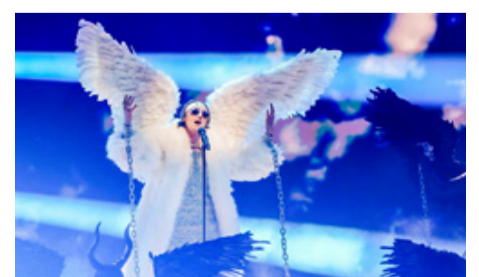
La gran final de la 65.ª edición del Festival de la Canción de Eurovisión.

la Canción de Eurovisión dio la victoria definitiva a la interpretación del grupo italiano Maneskin con la canción Zitti E Buoni (Cállate y bien), durante el habitual desfile de países y el sabor de al menos un triunfo incuestionable: el de haber logrado una gala del máximo nivel en tiempos de pandemia. (S.O)