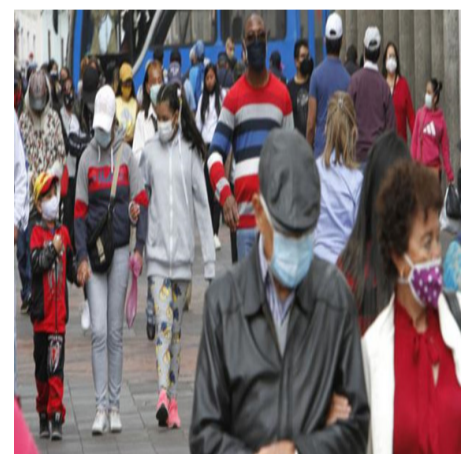
Aglomeración de personas circulando en el Centro Histórico de Quito, capital ecuatoriana.

La situación en los municipios no es muy cambiante respecto a las provinciales, Quito es la ciudad más castigada por la covid-19 con 139.739 contagios (263 más que la víspera), seguida de Guayaquil con