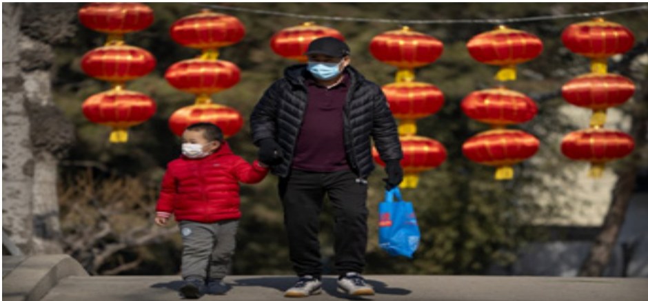
El envejecimiento va en aumento y la natalidad decae.

C hina.- El lunes 31 de mayo China anunció sobre su nueva medida para que la tasa de natalidad del país asiático no descienda, con esto dan fin a la política que tenía establecida en donde solo permitía que una pareja de casados puedan tener máximo dos hijos.