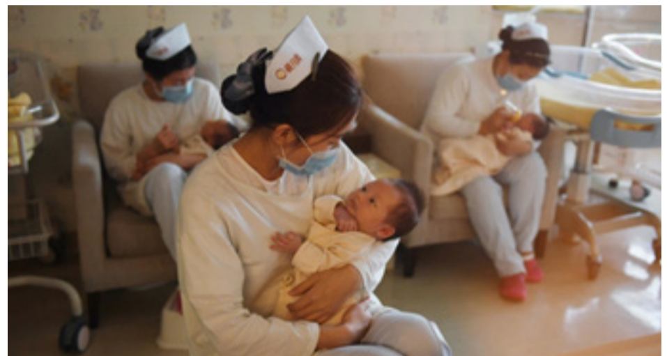
El futuro el país depende de los niveles de reproducción que haya dentro de él.

del planeta por lo que tuvo que establecer una política denominada ‘hijo único’ pero para el 2016 esta política se cambió al límite de dos hijos, ahora se espera que esta ley se pruebe para los tres hijos ya que los nacimientos han disminuido considerablemente. (D.G)