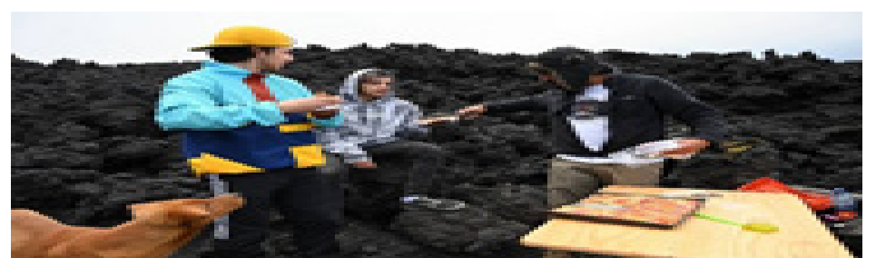
Turistas disfrutando de su estadía en el volcán Pacaya.

de lava ardiente que brota del furioso volcán Pacaya, en el sur de Guatemala. “Muchas personas en la actualidad vienen a disfrutar de la experiencia de comer una pizza hecha a base de calor volcánico”, señala García a la Agencia France-Press en la zona rocosa que conduce al cráter del volcán, y que con el tiempo se convirtió en su lugar de trabajo. La idea surgió en 2013, fue hace tres años que este emprendedor empezó a hornear pizzas usando la actividad del volcán como fuente de calor. Comentó que “Los primeros días no mucho se vendía”, también señala que ahora la suerte le cambió tras estallar su fama en las redes sociales. (S.O)