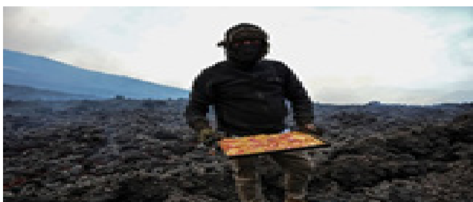
La pizza que se cocina sobre la lava de un volcán en Guatemala.