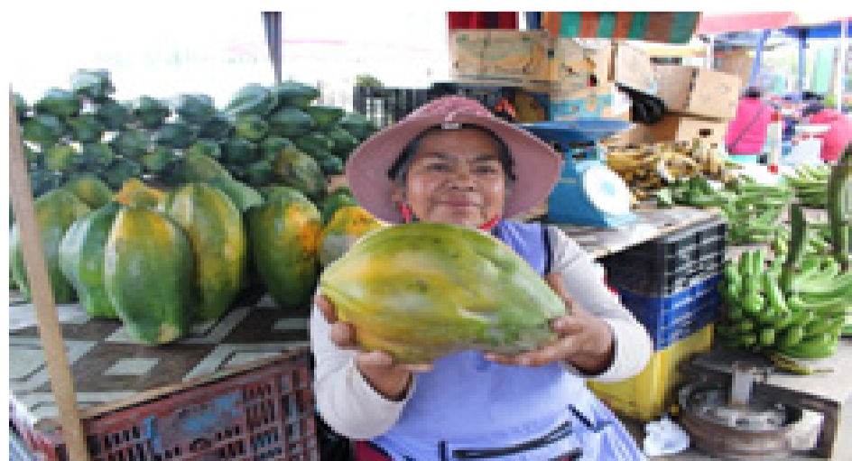
La mujer del campo es vida, liderazgo y amor .

Vendo productos traídos principalmente de la provincia de Zamora Chinchipe, entre ellos están la papaya, plátano, yuca, naranjilla, naranja, chonta y mandarina.