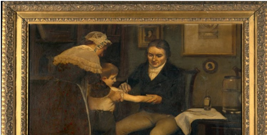
Edward Jenner realizando su primera vacunación en James Philips a un niño de ocho años.

Estados Unidos.- Esta historia la protagonizan personajes tan curiosos como un médico rural, una ordeñadora a quien su vaca ‘Blossom’ había contagiado de viruela, o un grupo de 22 huérfanos que llevaron en su propio cuerpo la vacuna de Europa a América. No cabe duda alguna de que una de las medidas sanitarias que mayor beneficio ha aportado a la humanidad han sido las vacunas. Previenen enfermedades que antes eran re-