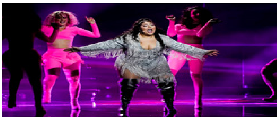
El rock se volvió una tendencia este año.

I talia.- Con 26 países participantes y 3.500 personas en público, el escenario del Ahoy Rotterdam (Países Bajos) dieron apertura para la noche de música escenografías imposibles y arritmias causadas por el reparto de votos y vio triunfar al grupo italiano Maneskin (Italia). Los italianos se habían presentado como uno de los principales aspirantes de la noche, junto con la francesa Barbara Pravi con Voilà y la maltesa Destiny con Je Me Casse. Aunque también se esperaban posibles sorpresas de la mano