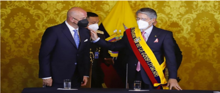
Posicionamiento como primer mandatario de Ecuador del presidente electo, Guillermo Lasso.

W ashington.- Human Rights y el observatorio de Derechos y Justicia (OFJ) señalan que el nuevo presidente de Ecuador, Guillermo Lasso, debe priorizar la implementación de las sentencias de la Corte Constitucional que protegen los derechos humanos. En