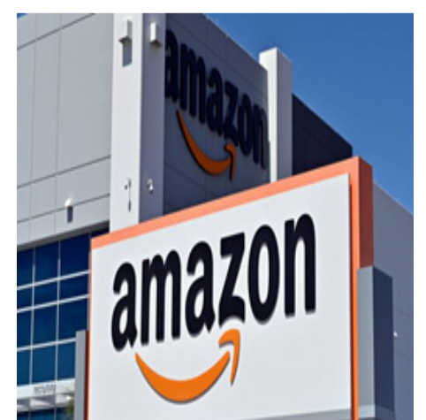
Esta plataforma de streaming busca liderar en la web. (Periódico El País)

mium al nivel mundial, se encuentra adelante de Disney+ que tiene 103 millones y busca sobre pasar a la plataforma de Netflix que cuenta con un alrededor de 207 millones de usuarios. (D.G)