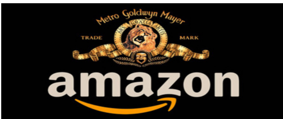
Amazon adquiere más de 4.000 películas y 17.000 series de televisión.

Estados Unidos.- La compañía Amazon, ha adquirido Metro Goldwyn Mayer (MGM), una compañía estadounidense de producción, distribución de películas de cine y programas de televisión más importante de Hollywood, por un monto de 8.450 millones de dólares. Este acuerdo se considera histórico en el mundo de Hollywood, Amazon adquiere una de las bibliotecas de cine y televisión más grande y famosa de la industria, el streaming