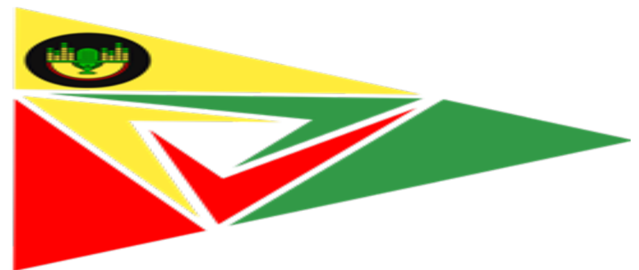
Logo de Radio Arbolada Macará.

A pocos días de cumplir un año de vida, Radio Alborada está feliz y convencida de poder brindar su experiencia a beneficio del ISTLA. De esta manera, el instituto sigue creciendo a base de convenios lo cual es beneficioso para sus estudiantes y para la sociedad. (C.P)