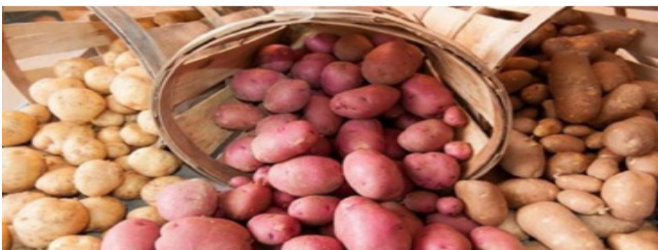
La papa peruana una de las colonizadoras en el Planeta Rojo. (Portal de noticias RPP)

E stados Unidos.- Tras el proyecto de la Nasa de llegar a Marte y colonizar, se han comenzado a estudiar todas las alternativas posibles para que se brinde una buena experiencia a quienes tenga la oportunidad de