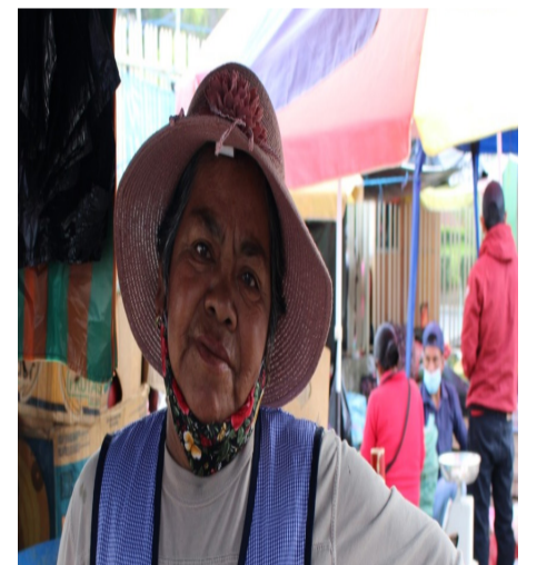
Su rostro muestra la felicidad de una mujer trabajadora.

La vida me enseñó que aunque sea duro siempre se debe seguir adelante y ver las maneras de avanzar, todo trabajo sirve y es digno de admirar. A pesar de mis 67 años yo puedo decir que tengo toda la vitalidad para seguir luchando por lo que quiero y también para poder ayudar a mis hijos en lo que más pueda, siempre estaré para ellos.