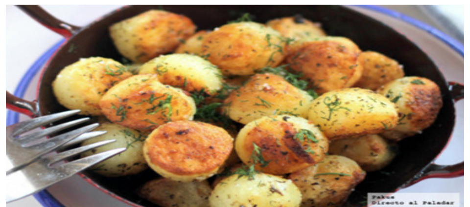
Con este producto se puede preparar miles de platillos distintos.

las extremas condiciones que hay en el planeta rojo como temperaturas muy frías o suelos áridos y salinos. La papa Tacna ha sido la seleccionada para ser el primer alimento que será llevado al espacio (D.G)