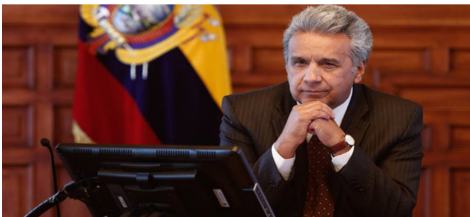
Expresidente de Ecuador, Lenín Moreno.

E cuador. – El expresidente de la República del Ecuador, Lenín Moreno, quien el lunes 24 de mayo se despidió de sus cargos, pasará a la historia como el presidente que debió hacer frente a la crisis económica más profunda que ha tenido el país