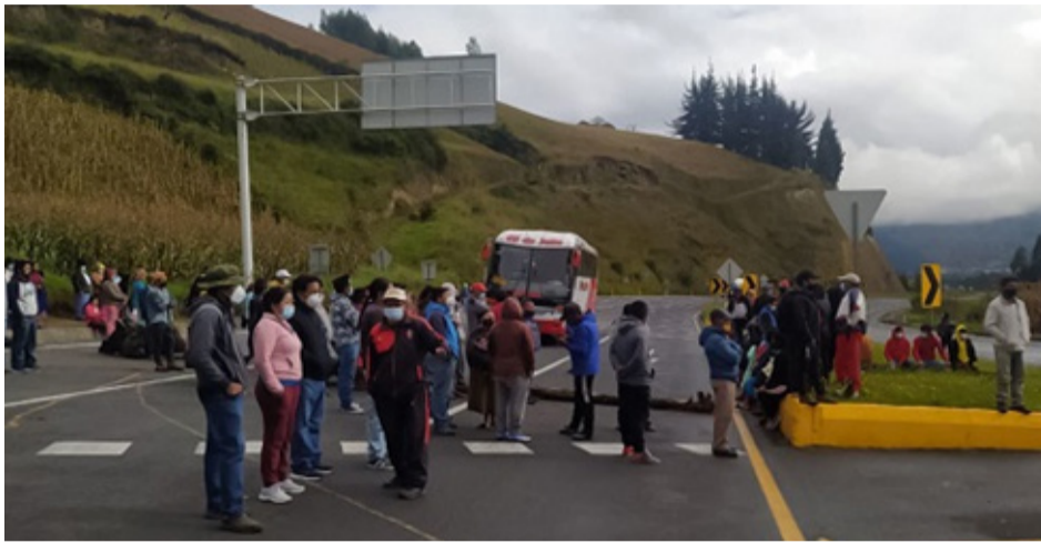
Protesta de organizaciones sociales de Ecuador en Imbabura exigiendo la derogación de varios decretos.

I mbabura.- La mañana del martes 25 de mayo del 2021 tras el posicionamiento del nuevo presidente de Ecuador, Guillermo Lasso, enfrenta su primera protesta por parte de organizaciones sociales, indígenas y campesinas de la provincia de Imbabura, en el norte