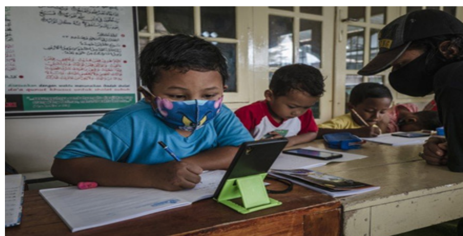
El estrés en niños por las clases virtuales está cada vez más presente. (Blog clarin.com)

E cuador.- Ya se va cumplir más de un año y medio desde que empezó la pandemia por Covid-19 y de igual manera las clases se tuvieron que pasar a las aulas virtuales, todo eso para poder resguardar la seguridad de los estudiantes de cada uno de los establecimientos educativos.