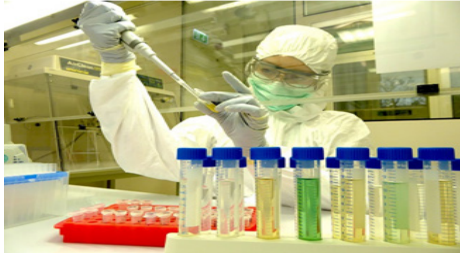
Los científicos continúan buscando antídotos fuertes para combatir el covid.