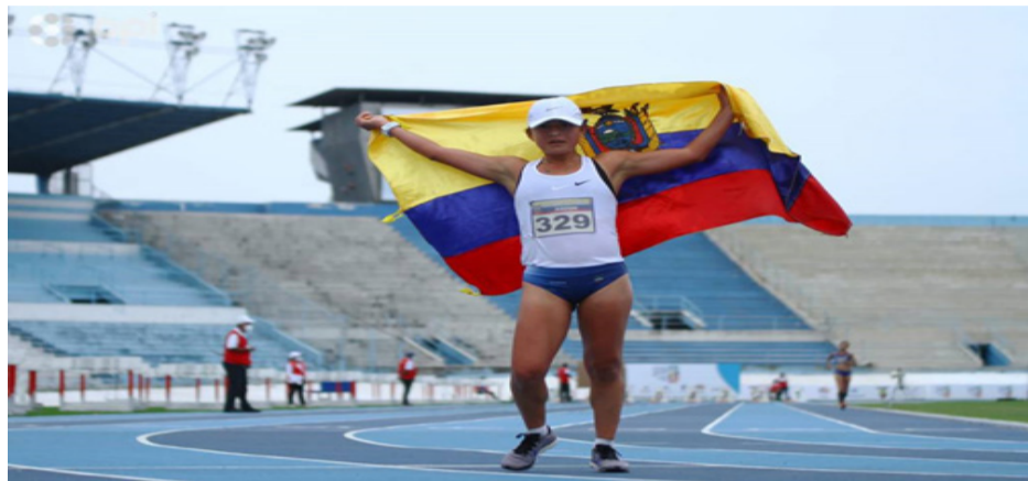
Glenda ahora es el orgullo de todo un país entero.

E cuador.- La atleta Glenda Morejón obtuvo el primer lugar en el campeonato Sudamericano de atletismo, es acreedora de la medalla de oro en dicha disciplina con un tiempo de una hora, 29 minutos y 24.61 segundos en la competencia de 20.000 metros marcha en la categoría femenina. La competencia se llevó a cabo el 29 de mayo en el estadio Modelo Alberto Spencer de Guayaquil, con tan solo 20 años obtuvo un nuevo record Sudamericano de adultos en la Sub 23 con el mejor registro del año en pista.