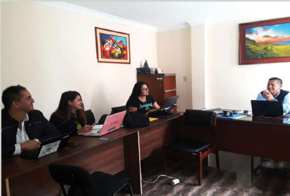
Comisión de Vinculación

La Comisión se organiza para debatir proyectos de vinculación del ITSLA, además nuevas novedades del departamento de Marketing.