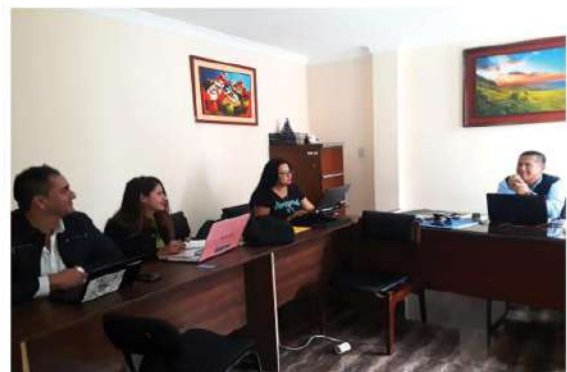
Comisión de Vinculación

ca del nuevo departamento de Marketing, además señaló que el equipo trabaja en detalles específicos de este proyecto. Es importante mencionar que la comisión también se encargará de entablar los acuerdos con otras empresas y así tramitar el trabajo que van a realizar docentes, estudiantes y personal administrativo. En esta reunión se debía coordinar puntos relevantes como el logo y slogan del Departamento de Marketing, es así que los presentes dieron sus sugerencias y opinaron al respecto, sin embargo, conforme se den las reuniones para plantear este proyecto, se irán puliendo cada una de sus partes.