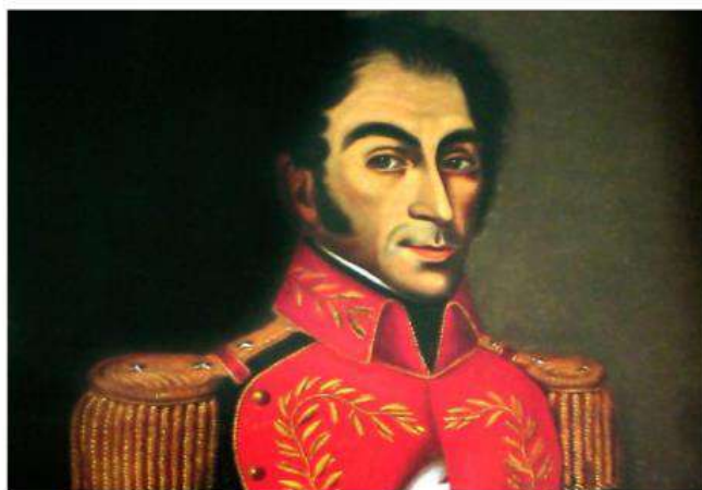
Simón Bolívar

U n 24 de julio de 1783, en la ciudad de Caracas, nació Simón José Antonio de la Santísima Trinidad de Bolívar y Palacios, fue un militar y político venezolano, fundador de las repúblicas de la Gran Colombia y Bolivia. Conocido como Simón Bolívar, vivió 47 años (17 de diciembre de 1830) y dentro de ella dirigió las guerras independentistas de Venezuela, Colombia, Ecuador, Perú además de la creación de Bolivia. R edactor de constituciones y proyectos de leyes, varias veces presidente, nacido en rica cuna y muerto pobre. Declinó la posibilidad de declararse emperador y el título que siempre prefirió fue el de «Libertador». El «Libertador» título honorífico concedido el Cabildo de Mérida – Venezuela en 1813 que, tras serle ratificado en Caracas en ese mismo año, quedó asociado a su nombre.