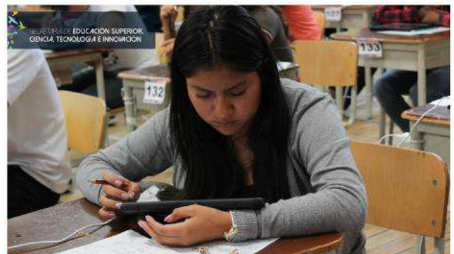
Revisar notas quienes rindieron la evaluación el segundo período de 2019

Es importante que los jóvenes tengan presente que en la hoja de aciertos consta solo el número de preguntas correctas y erradas, no la calificación. La nota final es el resultado de la suma del puntaje obtenido en cada pregunta, el cual está establecido en función de su complejidad.