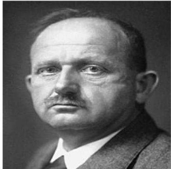
Hans Fischer

muerte tuvo plaza de profesor de química orgánica en el Technische Hochschule en Múnich. El trabajo científico de Fischer estaba principalmente relacionado con la investigación de los pigmentos de la sangre, la bilis y también la clorofila de las hojas, así como la química de las porfirinas, de los que derivan esos pigmentos. Realmente de especial importancia fue la síntesis de la bilirrubina y de la hemina, uno de los componentes de la hemoglobina.